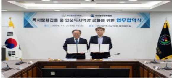
부산시교육청(왼쪽)이 27일 오전 부산교육청에서 대한출판문화협회와 독서문화진흥을 위한 업무협약을 체결했다.

부산시교육청은 27일 오전 부산교육청에서 대한출판문화협회와 독서문화진흥을 위한 업무협약을 체결했다.